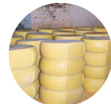
Традиционален џалчки кашкавал (нема заштитена ознака)

Производителите треба да обезбедат што е можно поквалитетни сировини, да внимаваат на хигиенската преработка и безбедноста на традиционално произведената храна. Тоа значи дека традиционалната храна мора да биде безбедна за консумација.